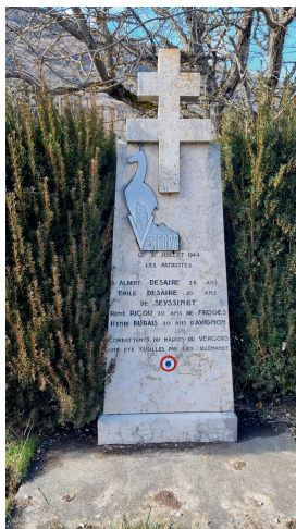
La stèle ou l'on peut une nouvelle fois voir un chamois.