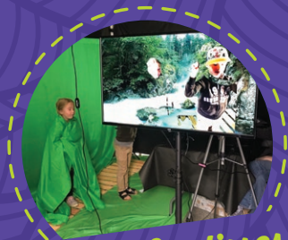
Stands Couloisses du cinéma