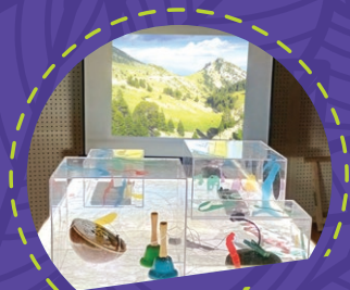
« Cinéoké » Jeu de ciné-concert itinérant